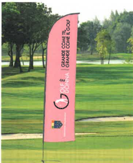
Bandiera a coltello