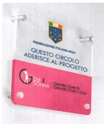
Targa ingresso circolo