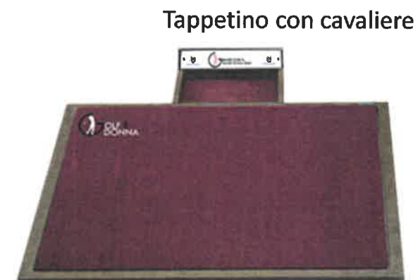
Tappetino con cavaliere