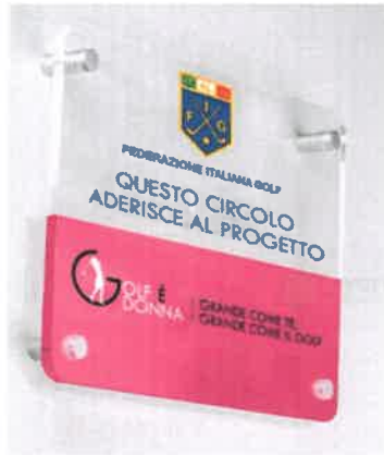
Targa ingresso circolo