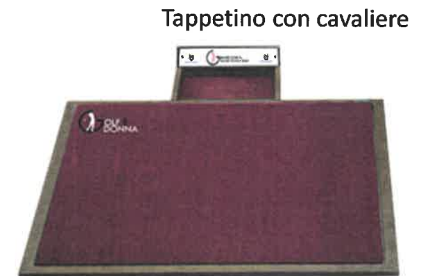
Tappetino con cavaliere