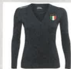
MAGLIONCINO MERINO BLU