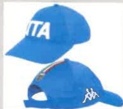
BASEBALL CAP AZZURRO