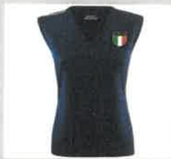
SMANICATO MERINO BLU