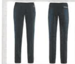
PANTALONE LUNGO BLU