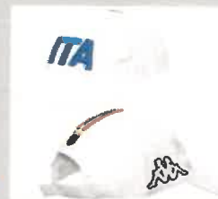
BASEBALL CAP BIANCO