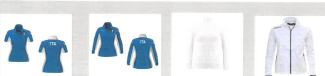
KOMBAT M.C. AZZURRA