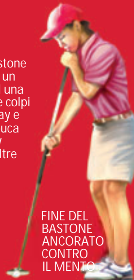
FINE DEL BASTONE ANCORATO CONTRO IL MENTO

QUESTA NON È UNA REGOLA PER L'EQUIPAGGIAMENTO